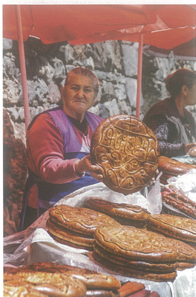
BRIOCHE DE PÂQUES.